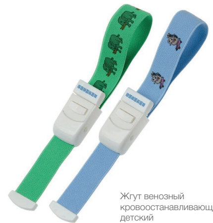
Жгут венозный кровоостанавливающий детский