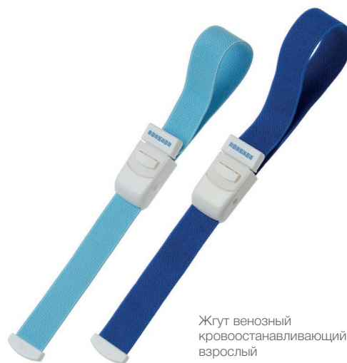
Жгут венозный кровоостанавливающий взрослый